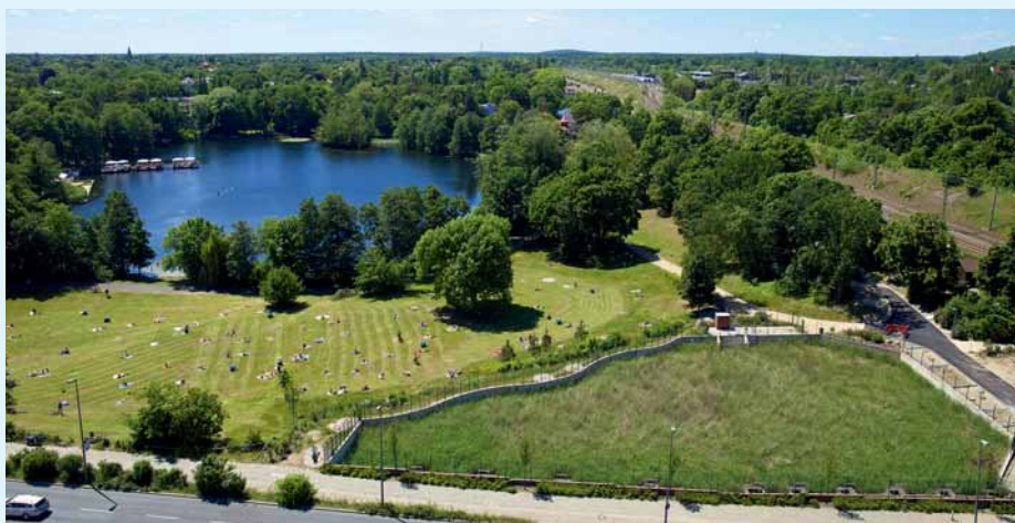
BADEBETRIEB AM BERLINER HALENSEE:

Die Belastung von Niederschlagsabläufen ist jedoch sehr unterschiedlich. Hier sind vor allem Metalldächer und Verkehrsflächen mit hohem Verkehrsaufkommen sowie