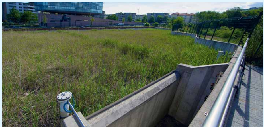
Notüberlauf des Retentionsbodenfilters in Berlin-Halensee