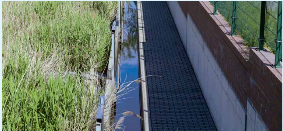
Zulaufrinne für den Bodenfilter

Lange Zeit war die rasche und möglichst vollständige Ableitung von Niederschlagswasser aus Siedlungsgebieten erklärtes Ziel. Durch die hohen Investitionen in die Abwasserreinigung hat sich die Gewässergüte in den vergangenen Jahrzehnten deutlich verbessert. Daher werden seitens des Gewässerschutzes heute vermehrt andere Stoffeintragspfade betrachtet. Neben der Landwirtschaft sind häufig stoßweise Einleitungen von Niederschlagsabflüssen für hydraulische