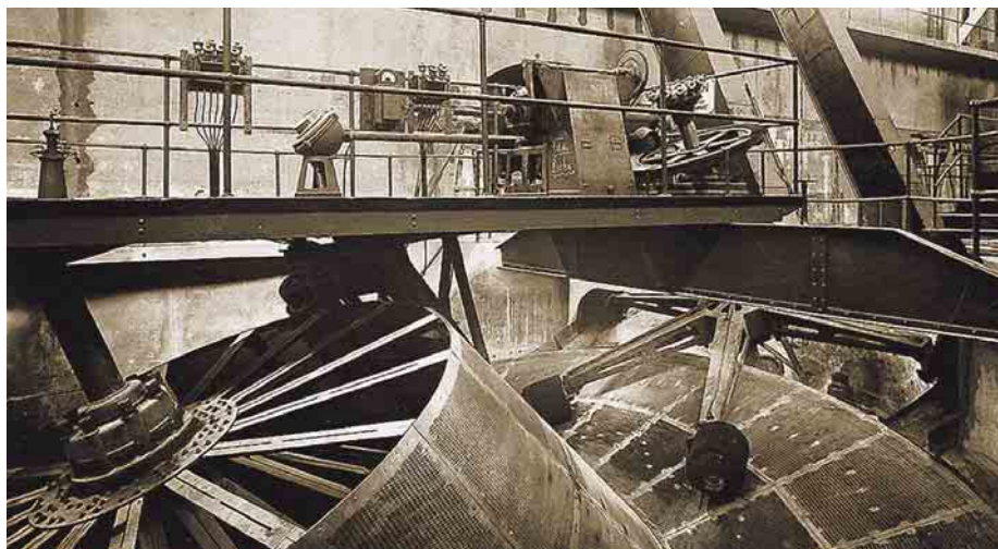
IM JAHR 1913: Detailaufnahme der Siebscheiben