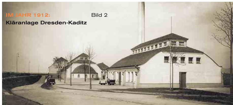
IM JAHR 1912: Kläranlage Dresden-Kaditz

Parallel zum Bau der Abwasserbehandlung entstand eine völlig neue Schlammbehandlungsanlage, deren Probetrieb im Oktober 1994 startete. Die Faulung und Entwässerung des Schlamms auf Entwässerungsplätzen wurde ersetzt durch eine maschinelle Entwässerung und thermische Trocknung. Der Primär- und der Überschussschlamm werden seither in Absetzbecken eingedickt und in Zentrifugen weiter entwässert. Zuletzt wird der Schlamm in Scheibentrocknern mit heißem Dampf weiterbehandelt, bis er nur noch 10 Prozent Wasser enthält. Täglich fallen so rund 50 t getrockneten Schlamms an. Über die Zwischenstation Kompostierungsanlage erfolgt letztlich die Verwertung im Landschaftsbau zum Beispiel bei der Rekultivierung von ehemaligen Tagebauflächen.