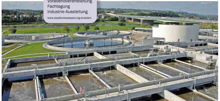
Neue biologische Behandlungsstufe, 2005

Parallel zum Um- und Neubau des Klärwerkes wurde auf dem Gelände ein Regenüberlaufbecken errichtet. Damit können Schwankungen beim Anfall des Abwassers infolge starker Niederschläge reguliert und ein Abschlagen von unbehandeltem Wasser in die Elbe vermieden werden.