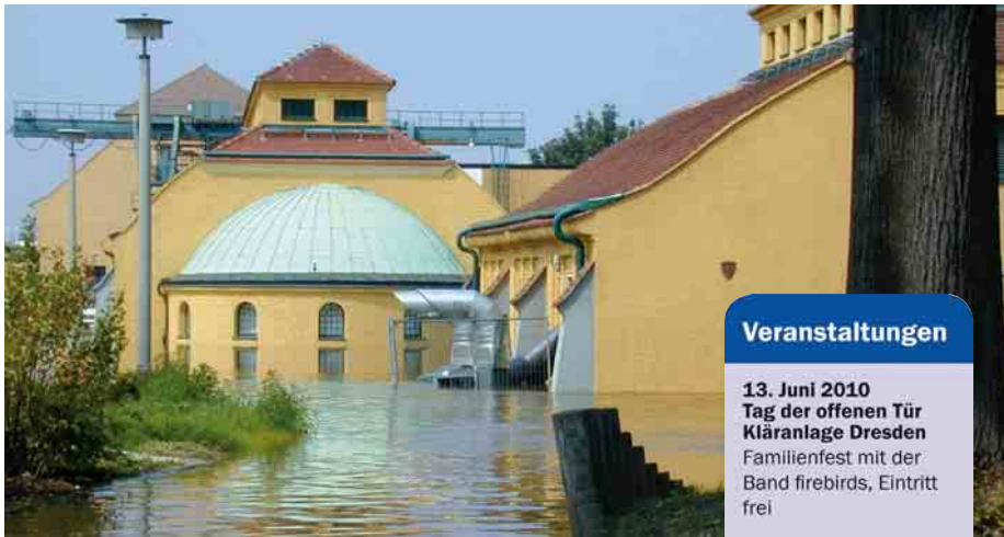
HOCHWASSER 2002: überflutete Siebscheibenhalle