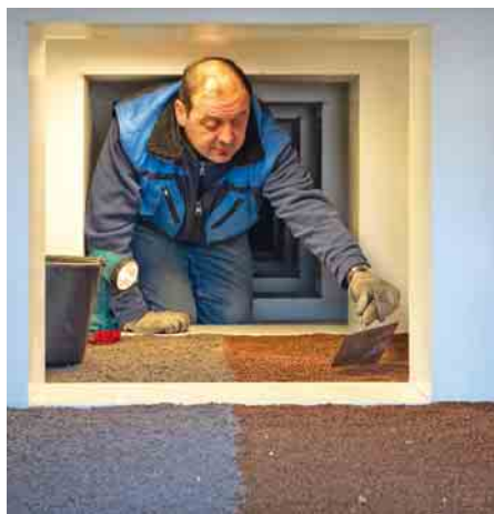
Erstmals ist das Arbeiten innerhalb einer Rigole möglich