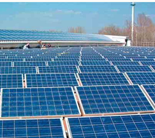
Photovoltaikanlage auf der Dachfläche des Regenüberlaufbeckens, 2005