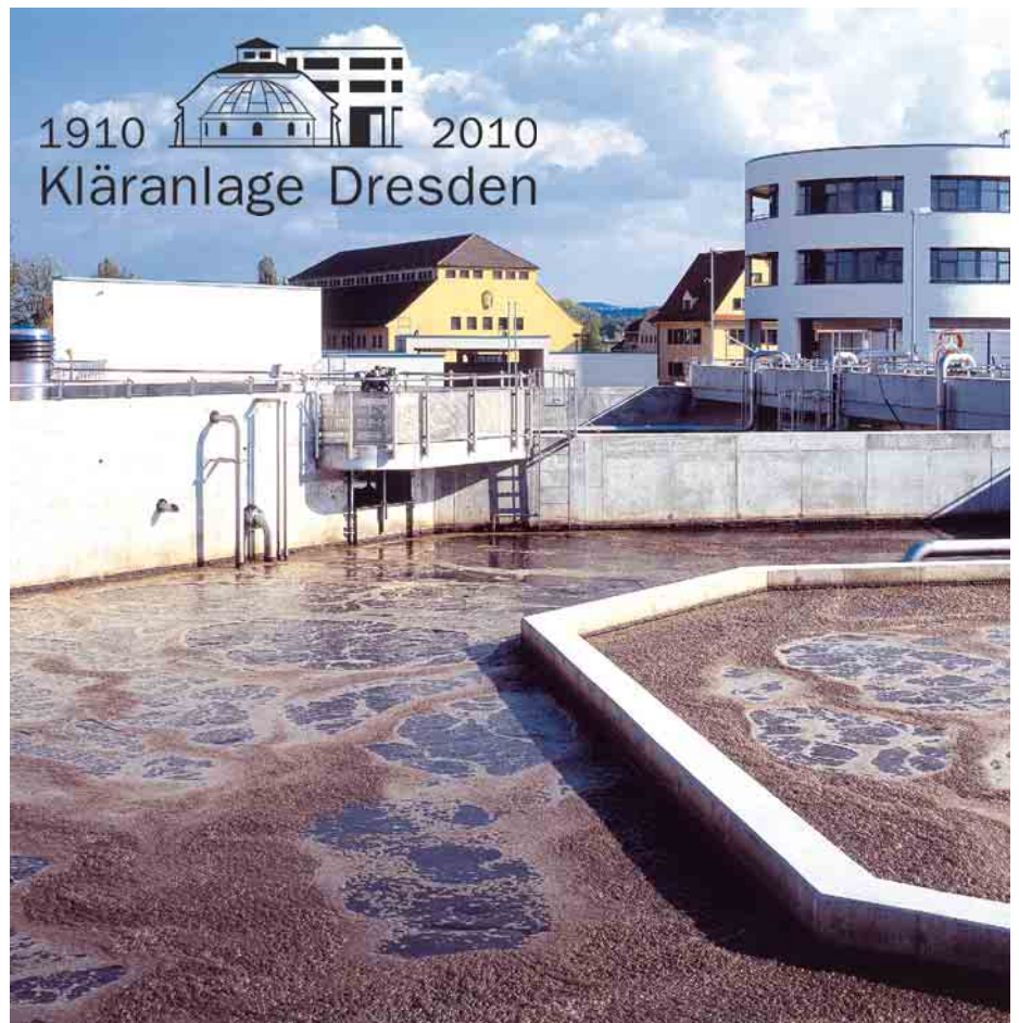
DIE NEUEN BAUWERKE – hier die biologische Abwasserbehandlung – sind formvollendet im historischen Areal integriert, 2005